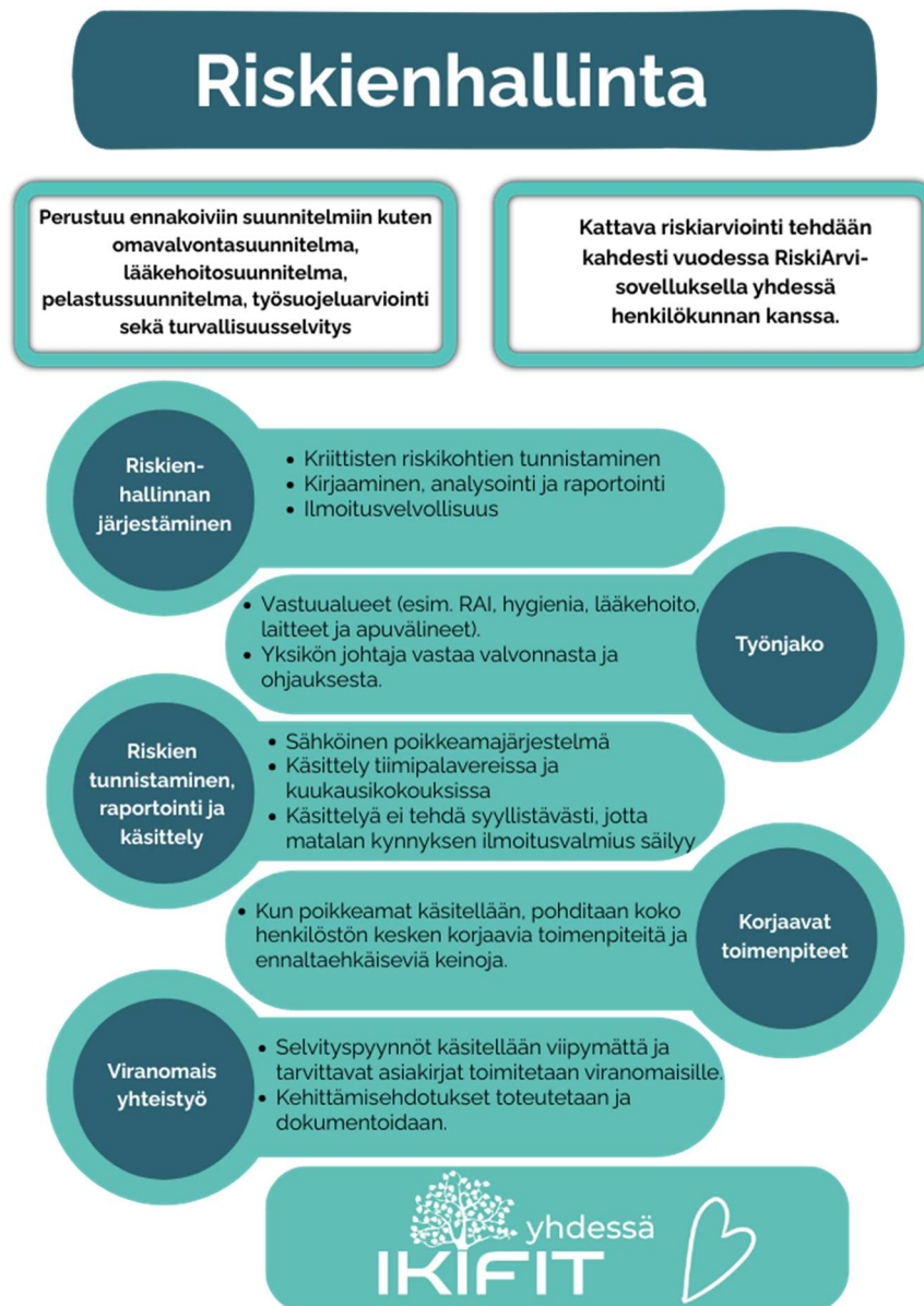
Kuvio 5. Riskienhallintaprosessi

Riskienhallinta on tunnistettua ja suunniteltua toimintaa. Se koostuu yksikön toimintasuunnitelmasta, turvallisuusselvityksestä ja palo- ja pelastussuunnitelmasta, omavalvontasuunnitelmasta, työsuojelulain mukaisesta riskien arvioinnista, lääkehoitosuunnitelmasta sekä varautumissuunnitelmasta. Riskienhallinnan kokonaisprosessi on kuvattu kuviossa 5.