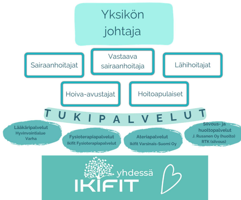
Kuvio 4. Henkilöstörakenne