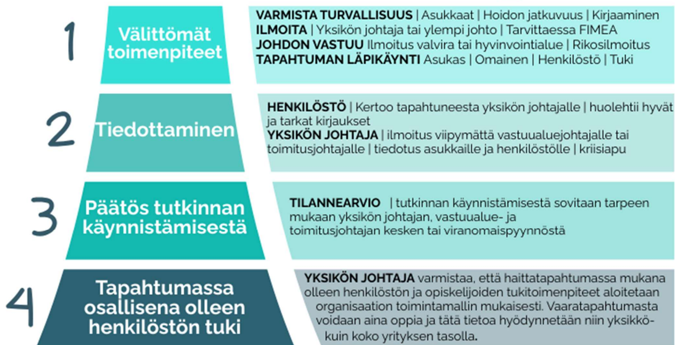
Kuvio 6. Vakavan vaaratapahtuman käsittelyprosessi