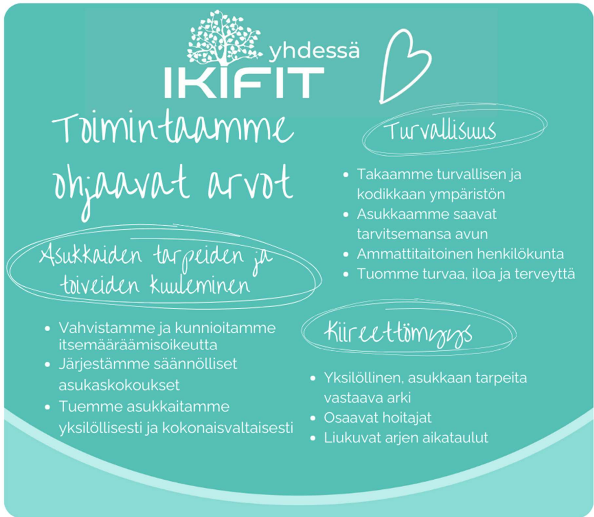
Kuvio 1. Ikifit Varsinais-Suomi Oy:n toimintaa ohjaavat arvot

Hyvinvointikeskus Herttuankulma tarjoaa ympärivuorokautista palveluasumista ikääntyneille henkilöille. Herttuankulma on kaksikerroksinen yksikkö ja kummassakin kerroksessa on 25 asuntoa. Asunnoissa on 21,5m 2 ja jokaisessa asunnossa oma suihku ja WC. Huoneen varustukseen kuuluu sähkösänky, kiinteä vaatekaappikaluste sekä yöpöytä. Asukkaat sisustavat asunnot omannäköisekseen. Työskentelemme kuntouttavalla, ihmisen yksilöllistä sekä kokonaisvaltaista toimintakykyä tukevalla työotteella. Asukkaiden hyvän elämänlaadun toteutuminen on kaikkien työntekijöiden yhteinen päämäärä.