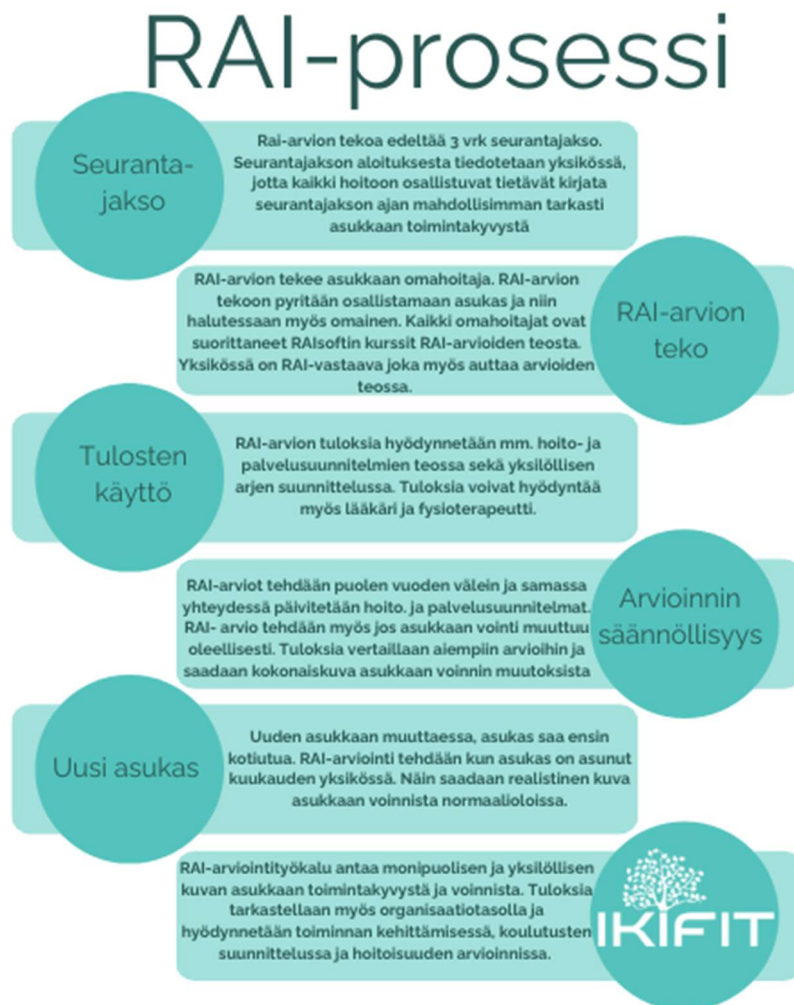
Kuvio 2. RAI-prosessikaavio

Yksikön johtaja seuraa henkilöstön koulutustarvetta yhdessä RAI-vastaavien kanssa. Asukkaiden RAI-arviointien toteutumisesta huolehtivat sairaanhoitajat, RAI-vastaavat sekä omahoitajat. Yksikön johtaja on vastuussa siitä, että arvioinnit toteutuvat ajallaan kaikkien asukkaiden kohdalla. RAI-prosessi on kuvattu tarkemmin kuviossa 2.